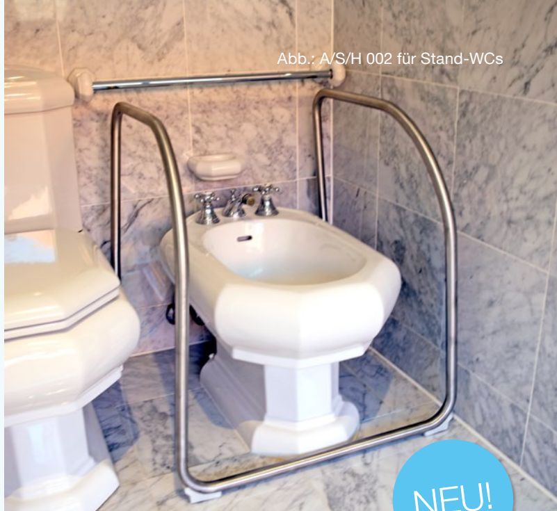
Abb.: A/S/H 002 für Stand-WCs